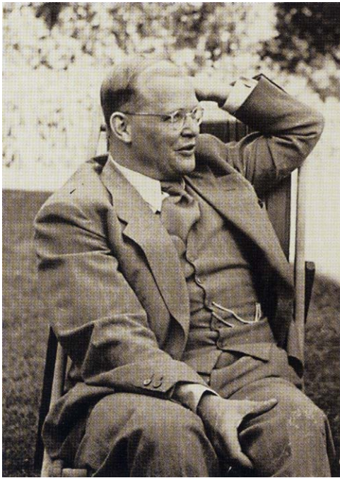
Bonhoeffer 1939 bei einem Besuch bei seiner Zwillingschwester Sabine in England