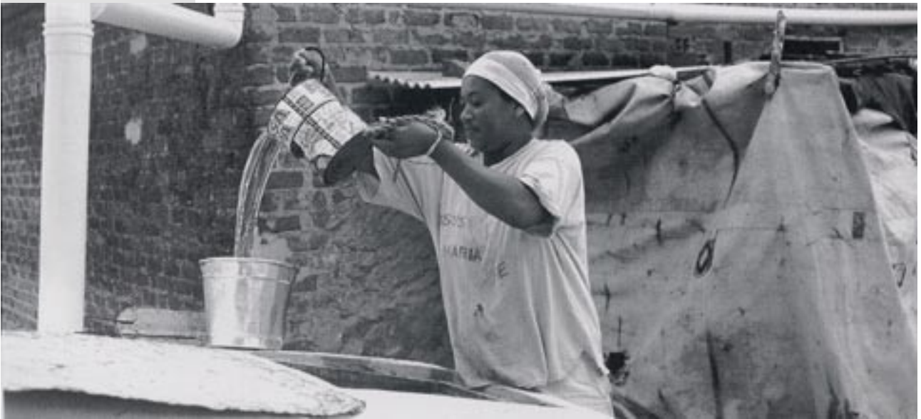
Brasilien: Zisternen für eine Millionen Familien