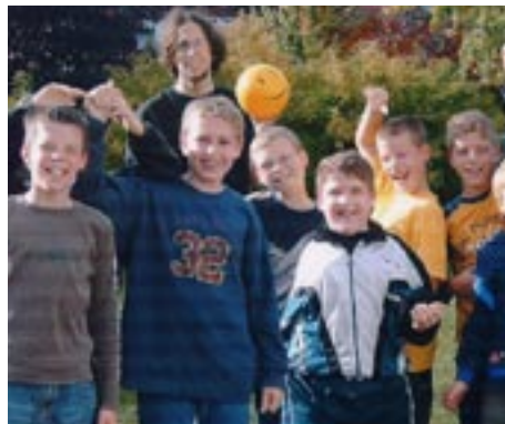
Mutig sein, heißt wissen, wer man ist.