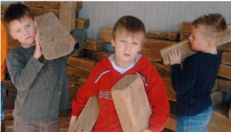
Mutig sein, heißt wissen, woher die Kraft kommt.