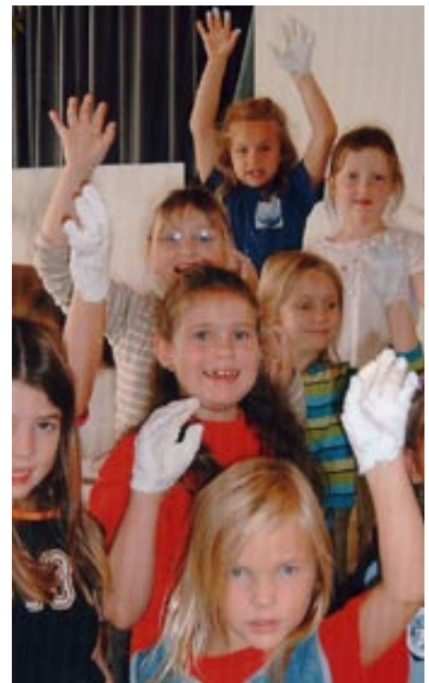
Mutig sein, heißt wissen, was man will.

Nach dem gemeinsamen Frühstück lernten sie die Frauen kennen: Maria aus Magdala, die Jesus von einer schlimmen Krankheit geheilt hat, die Frau aus Bethanien, die Jesus mit kostbarem Öl beschenkte, Maria und Martha, die beiden Schwestern, eine Frau, die mit Jesus diskutierte oder die mutigen Frauen, die Jesus am Kreuz ganz nah gewesen sind. Gemeinsam feierten Kinder, Teamer, Eltern und Gemeinde zum Abschluss der Woche einen Familiengottesdienst unter dem Thema: „Mutig! Maria“.